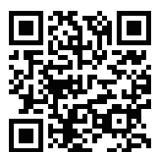
ケータイ用QRコード